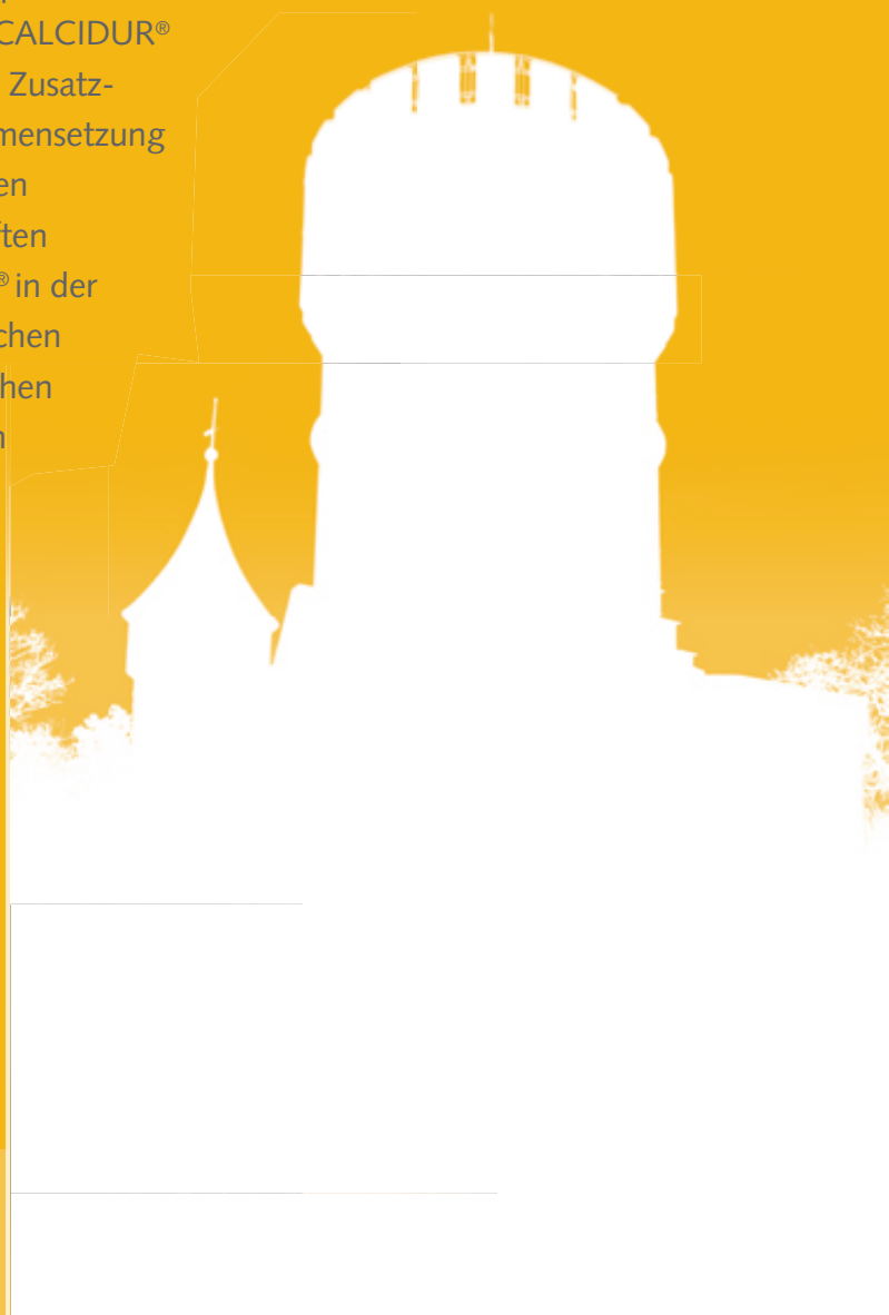
Schloss Landsberg, Meiningen