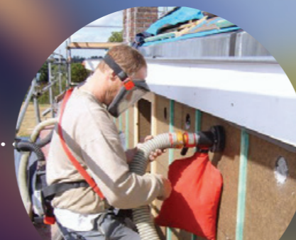
BINNEN- EN BUITENISOLATIE