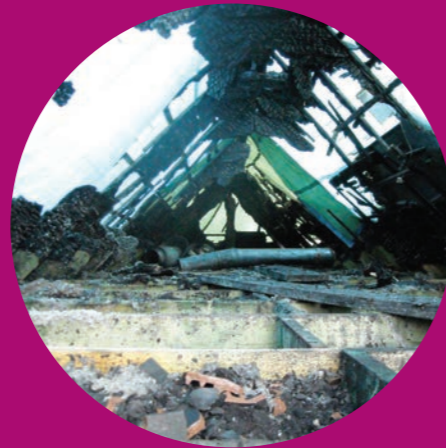
Vóór en na brand

Vóór de brand: cellulose-isolatie tussen balken van de zoldervloer - Na de brand: na weghalen van cellulose bleek dat balken intact waren gebleven.